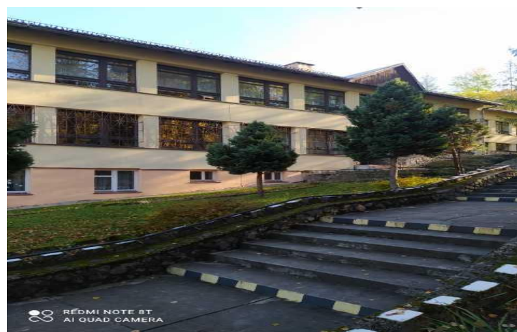
4) Szkoła Podstawowa im. Królowej Jadwigi w Zwardoniu,