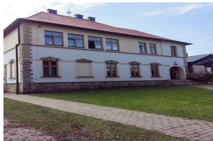
6) Przedszkole w Zwardoniu