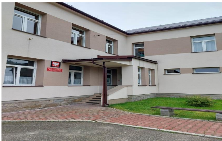
1) Szkoła Podstawowa wraz z oddziałem przedszkolnym im. Króla Jana III Sobieskiego w Rycerze Dolnej,

W roku szkolnym 2021/2022 w gminie Rajcza funkcjonowały następujące placówki publiczne: