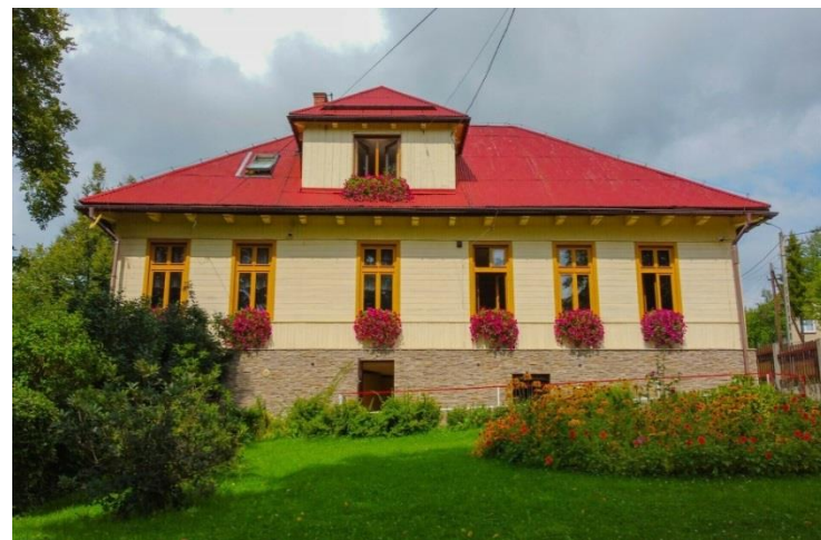
Szkoła Podstawowa wraz z oddziałem przedszkolnym Fundacji Elementarz