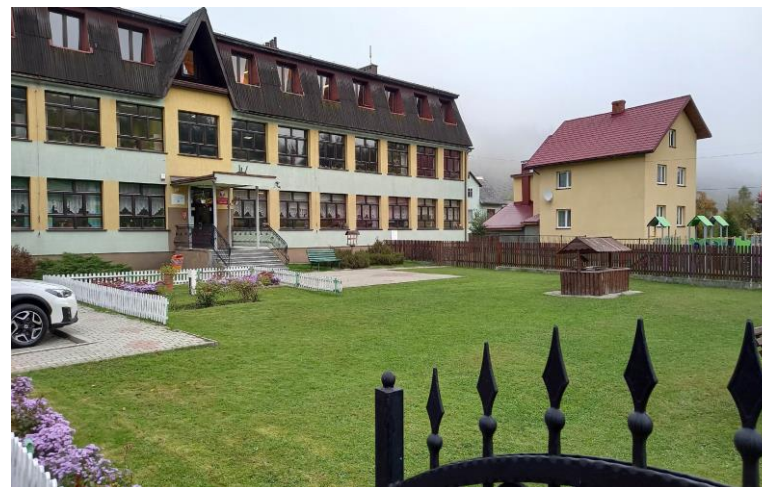
2) Szkoła Podstawowa wraz z oddziałem przedszkolnym im. Karola Wojtyły w Rycerze Górnej