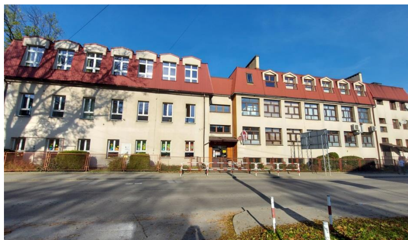
5) Szkoła Podstawowa im. Ks. Józefa Tischnera nr 1 w Rajczy