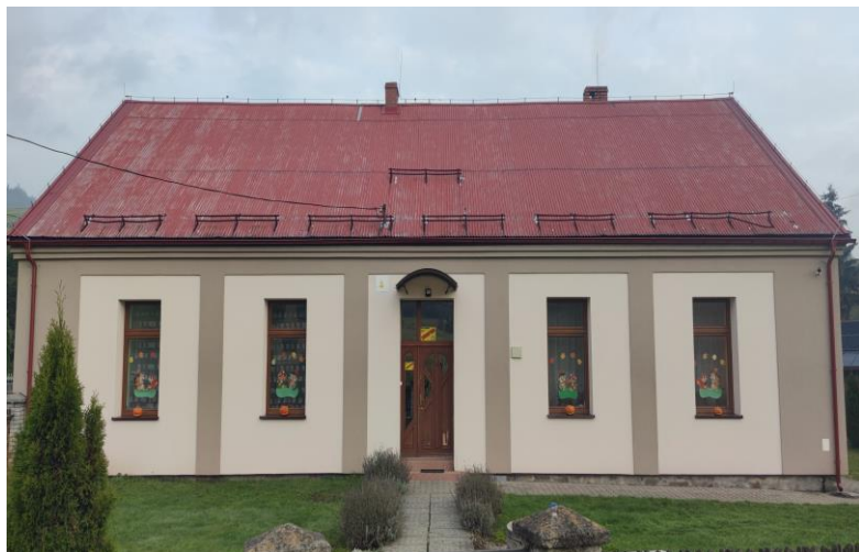
7) Przedszkole w Soli