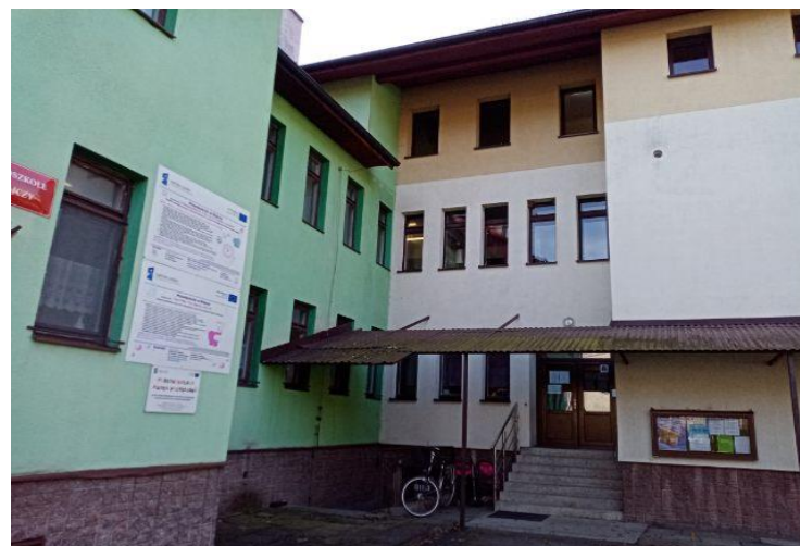
8) Przedszkole w Rajczy

Ponadto na terenie gminy działały również placówki niepubliczne: