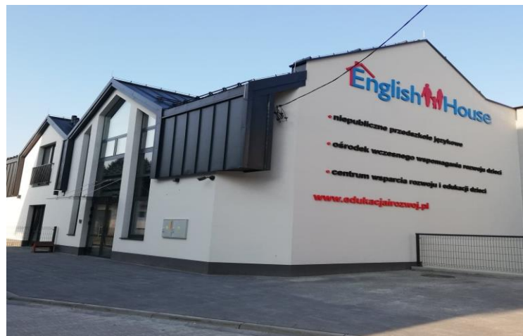
Niepubliczne Przedszkole Językowe „English House” w Rajczy

Ponadto na terenie gminy działały również placówki niepubliczne: