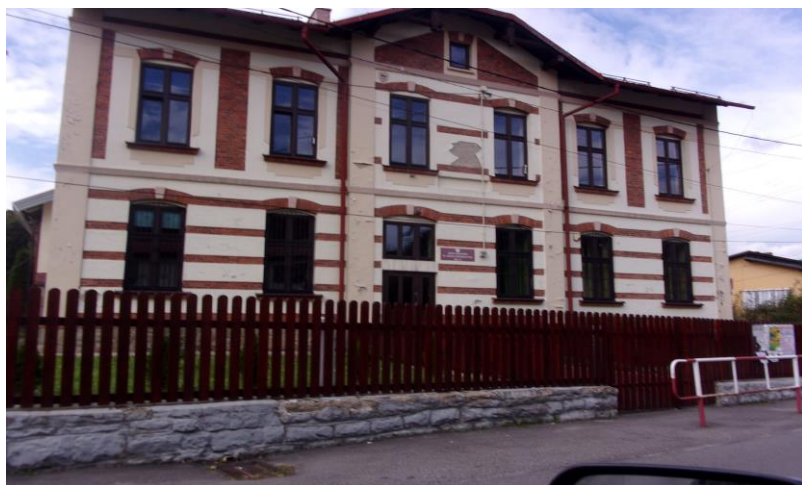
3) Szkoła Podstawowa im. Tadeusza Kościuszki w Soli,